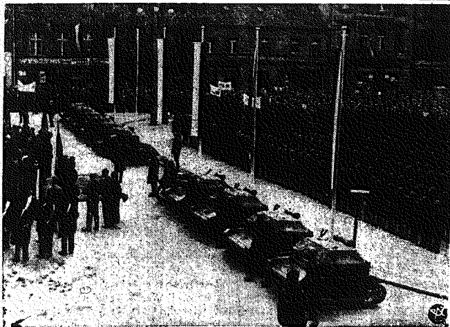
Oflarunek społeczeństwa śląskiego na dobrojelenie armii.