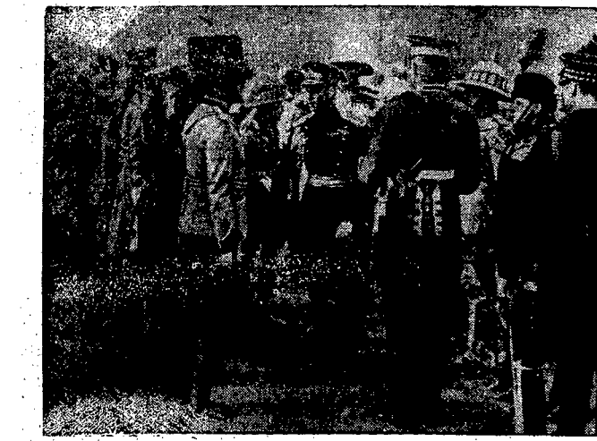
Król Jerzy VI dekoruje oficerów. W dwa dni po koronacji na dziedzińcu pałacu Buckingham w Londynie król Jerzy VI (na ryc. w środku) dokonał dekoracji medalem koronacyjnym kilkuset wyższych oficerów armii brytyjskiej. Ilustracja przedstawia fragment tej uroczystości.

Podobnie w kierunku powrotnym pociąg, jadący z nad morza, rozdzielane będą w Orłowie na 2 składy, które następnie łącząc się będą w Tczewie.