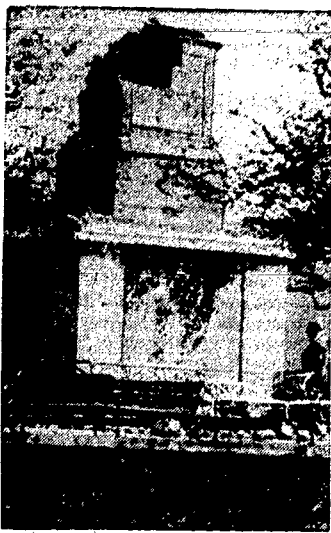
Zamach bombowy na pomnik królewski. W stolicy Irlandii w Dublinie, nieznani sprawcy w dniu koronacji Jerzego VI wysadzili w powietrze pomnik króla Jerzego VI. Zdjęcie przedstawia cokół zniszczonego pomnika.

mu zaliczono areszt śledczy od dnia 12. marca 1936 do dnia dzisiejszego oraz w drodze amnestii zmniejszono mu karę więzienia do lat 3.