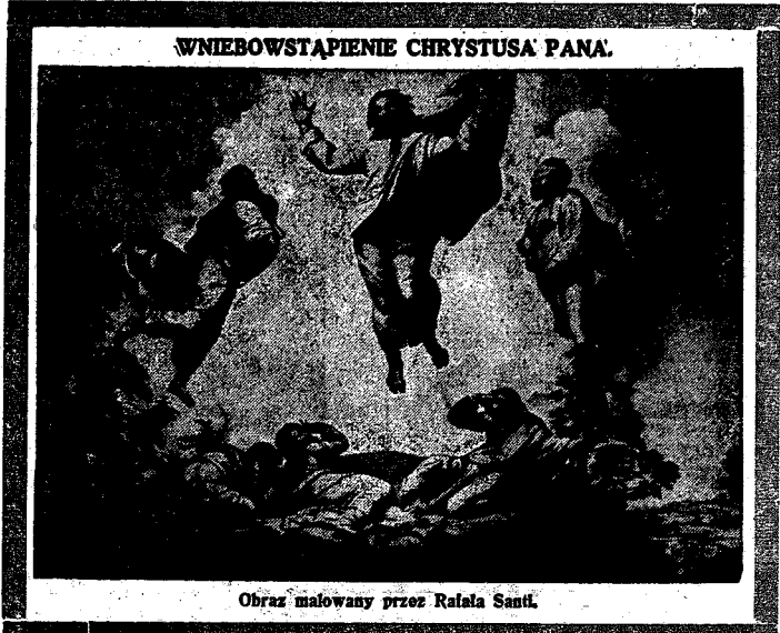
Obraz malowany przez Rafaela Santi.

Dopiero dzisiaj z pogranicza hiszpańskiego nadeszła wiadomość o krwawych wydarzeniach, podczas których