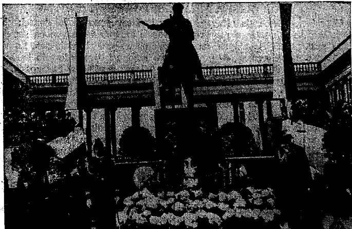
Wielka rewia w Warszawie w rocznicę Konstytucji 3 Maja. Z okazji 146-iej rocznicy uchwalenia Konstytucji 3-go Maja, odbyła się na placu Marszałka Józefa Piłsudskiego w Warszawie

jaństwa, a także w średniowieczu, obchód święta Wniebowstąpienia uświetniano uroczystą procesją publiczną, w Jerozolimie na Górę Oliwną, w okolicach której nastąpił fakt Wniebowstąpienia, w innych okolicach poza mury miasta, co było pamiątką wędrówki Jezusa Chrystusa z uczniami w stronę Betanii. Ślad tych procesji pozostał dotąd w niektórych parafiach, nie ma on jednak charakteru powszechności. Procesje z poprzedzających święto Wniebowstąpienia t. zw. Dni Krzyżowych nie mają nic wspólnego z dawnymi procesjami „do Betanii”. Powstały one w V w. naszej ery z inicjatywą św. Mamerta w diecezji Wienne we Francji jako procesje pokutne dla odwrócenia klęsk żywiołowych i na początku IX w., rozszerzone zostały przez papieża Leona III na cały Kościół. Cała Msza św. na uroczystość Wnie-