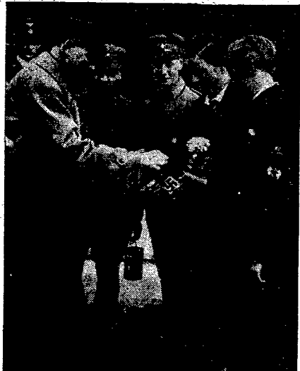
48-a rocznica urodzin kanclerza Hitlera. Wczoraj obchodzono w Rzeszy Niemieckiej w sposób uroczysty 48-a rocznicę urodzin kanclerza Adolfa Hitlera. W całym kraju odbyły się manifestacje na cześć solenizanta, urządzone przez placówki partii narodowych socjalistów. Zdjęcie nasze przedstawia kanclerza Hitlera w momencie składania ofiary do puszek, kwitujących młodzieży narodowo-socjalistycznej, na rzecz budowy domu młodzieży niemieckiej.

Wkrótce potem zgłębiono kleryka do kleryka. Kleryk umarł ze słowami: „Jezu dla Twojej miłości i dla dobra Hiszpanii! Tlum obrzuć wkońcu zwłoki kamieniami!