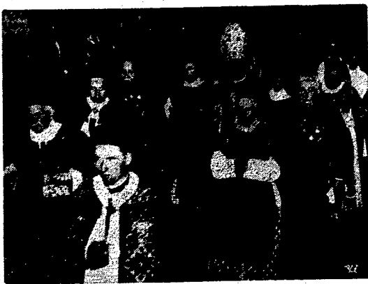
Złoty jubileusz kapłaństwa kardynała Verdiera.

Reprodukcjtemy fragment z ostatniej podróży inspekcyjnej p. premiera gen. dr. Felicjana Sławo-Składkowskiego po terenie woj. poznańskiego. — Na zdjęciu naszym widzimy szefa rządu podczas pobytu we Wsze-