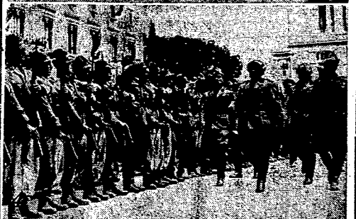
1) PROMOCJA PODCHORAŻYCH SAPERÓW. W Szkole Podchorążych Saperów odbyła się uroczysta promocja absolwentów szkoły. Uroczyste nabożeństwo połowa odprawił na stadionie szkoły biskup połowy J. E. ks. Gawlina. Po nabożeństwie, gen. Dąbkowski dokonał promocji absolwentów Szkoły na podporuczników. Zdjęcie przedstawia mszę św. przy ołtarzu połowym. 2) PODHALAŃSKI NIEDZIELNY UNIWERSYTET WIEJSKI. W Nowym Targu na Podhalu został onegdaj zakończony kurs Podhalańskiego Niedzielnego Uniwersytetu Wiejskiego. Zdjęcie nasze przedstawia uczestników kursu przed pomnikiem wielkiego piewcy Podhala Władysława Orkana w Nowym Targu. 3) AKCJA DOŻYWIANIA DZIECI. Reprodukujemy zdjęcie, przedstawiające piękny fragment z akcji dożywiania dzieci, prowadzonej przez Polskie Fabryki Kabli w Ożarowie. 4) OWACYJNE POWITANIE „CZARNYCH KOSZUL“. W Rzymie odbyło się uroczyste powitanie wracającej z Afryki dywizji strzelców, która specjalnie wyróżniała się w wojnie z Abisyńczykami. Na zdjęciu naszymi Mansoni przed frontem dywizji strzelców, na placu przed pałacem Weneckim. 5) PRZED KORONACJĄ KROLEWSKA W LONDYNIE. W związku ze zbliżającym się terminem koronacji króla Jerzego VI przybywają już do Londynu egzotyczni goście z domniów angielskich. Oto czterech hinduscy wojskowi, którzy wystąpią podczas uroczystości koronacyjnych, jako adiutanci królewscy.