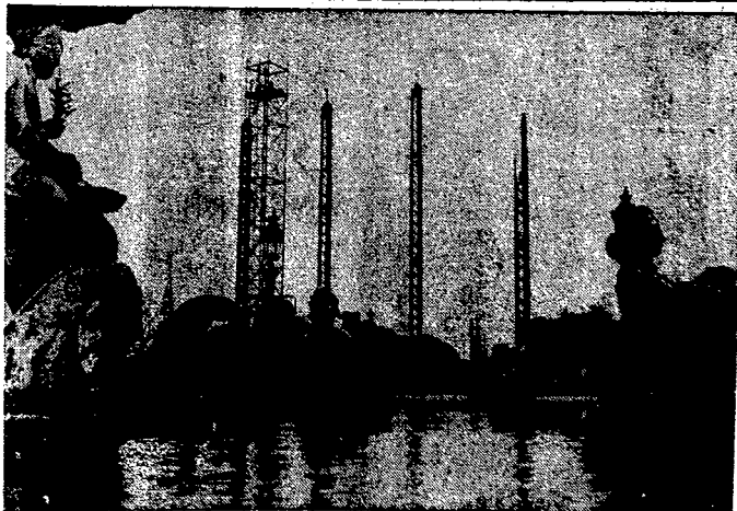
Przed otwarciem wystawy światowej w Paryżu.

Pieczywo powinno być ponad to — zgodnie z wymienionym rozporządzeniem — oznaczone nazwą mąki, z której zostało wytworzone, uwidoczniona na kartkach z firmą i adresem wytwórni. Jeżeli pieczywo wypiekane jest z mieszanin mąki żytniej i pszennej, to powinno być rów-