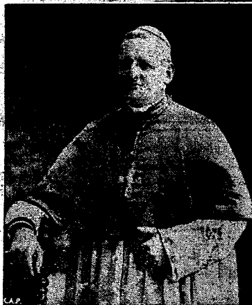
J. E. BISKUP LOURDES I TARDES KS. PIOTR GERLIER, który ǳis, w srode po południu przybywa do Częstochowy na Jasną Górę.

nia 1933 r. Było ich wszystkich 18, ostatnie 16 lipca 1858 roku t. j. w ǳień Matki Bożej Szkaplerznej. Najważniejsze z nich i ósme, nawołujące przez Maryję ludzkość do pokuty, dziewiąte, nakazujące Bernadecie drobnymi rękoma otworzyć w piasku i kamieniach cudowne źródło, zasilające ǳis swymi nadzwyczajnymi uzdrowieniami cały świat katolicki, jedenaste, potwierdzające przez Maryję dogmat Jej Niepokalanego Poczęcia, 4 lata przedtem ogłoszony za Papieża Piusa XI, wreszcie życzenia N. Panny Maryji, aby w miejscu objawień stanął kościół i chwala Boża była tam głoszona. — Wszystkie te życzenia i prorocze słowa N. Panny Maryji ziściły się zupełnie. ǳis stoi w Lourdes u świętej Groty cudownych objawień wspaniała Bazylika. Odbывают się tam uroczyste nabożeństwa i procesje, a pielgrzymi przybywają ze wszystkich stron katolickiego świata, doznają cudownych uzdrowień, które już nie na setki, ale całe tysiące się liczy, sprawdzone po wiele razy przez uczonych kościelnych i świeckich, nie wyłączając lekarzy różnego wyznania. Statystyka roczna duchowieństwa i pielgrzymów, nawiedzających tu cudowne miejsce, bardzo jest zbliżona do statystyki Jasnogórskiej, a nawet w niektórych wypadkach jej dorównywa. Z takiego to sławnego już ǳis w całym świecie miasta przybywa jutro do naszego grodu Dostojny Gość J. E. Ks. Biskup Gerlier. ǳienniki już podały Jego życiorys i żywą działalność jaką rozwija w