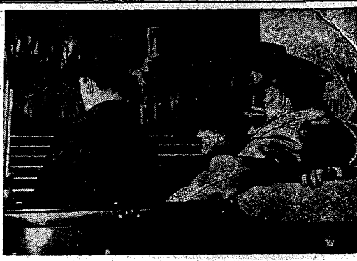
Ku czci Lincoln. W Waszyngtonie odbyła się z udziałem Prezydenta Stanów Zjednoczonych Roosevelta uroczysta akademia, poświęcona uczczeniu pamięci wielkiego Prezydenta Lincoln. Na zdjęciu naszymi reprodukcjami fragment tej uroczystości z Prezydentem Rooseveltem i rodziną u stóp pomnika Lincoln.

Kończąc, mówca apeluje do wicepremiera aby zrobił wszystko w kierunku wytworzenia w kraju ufnosć w stosunku do państwa.