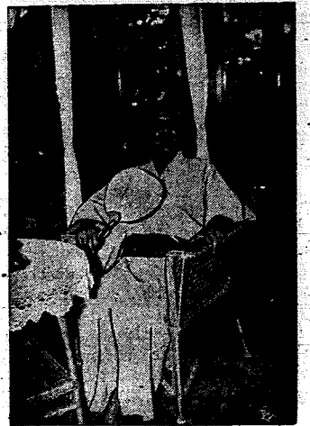
Nowy premier Japonii.

Jak donoszą, z zeznaniach Radka i Piatakowa, aresztowano bezpośrednio po tym 7-miu oficerów moskiewskiego garnizonu, b. burmistrza Moskwy Uglanowa,