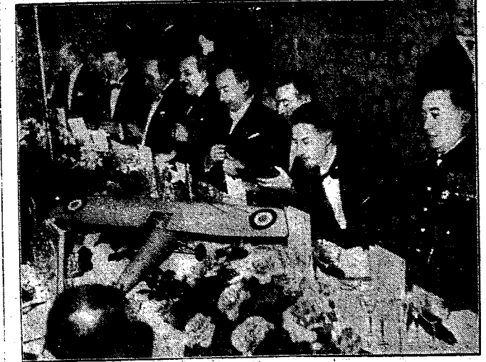
Bankiet na cześć francuskich lotników wojennych. Minister lotnictwa wydał w Paryżu wielki bankiet na cześć francuskich lotników wojennych, którzy odznaczili się w czasie wojny światowej. — Na zdjęciu min. lotnictwa (pośrodku) w otoczeniu zasłużonych lotników.

Zakopane. — Członek świąty książęcej pary holenderskiej p. Rotevell, po pobycie