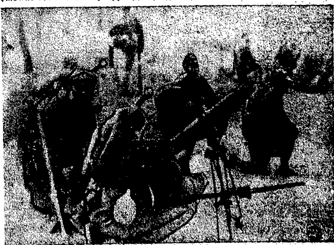
Z ostatnich wydarzeń w Chinach.

Szanghai. — W liście wystosowanym przed wyjazdem z Sian-Fu do Czang-Hsue-Lianga i Yang-Hu-Czenga, Czang-Kai Czek pisze m. in.: „Byłiscie pod wpływem reakcjonistów, lecz gotowi je śnieć naprawić swój błąd. Niemniej je dnak odpowiedzialność spada na was. Jako wasz zwierzchnik nie mogę nie na pietnować rozluźnienia dyscypliny, z po-