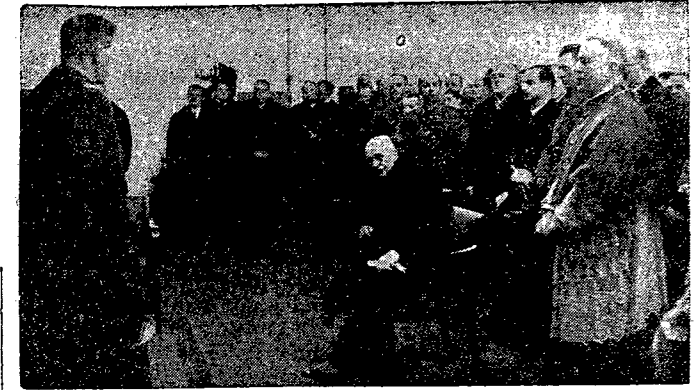
Nowa wytwórnia polskich płatowców

W czasie pobytu Donalda odbyła się z jego udziałem narada marszałków Ciang-Kai-Szeka i Ciang-Sueh-Lianga, na której Ciang-Kai-Szek oświadczył, że gotów jest osobiście wykonać program Ciang-Sueh-Lianga z