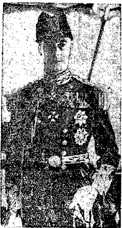
Ks. Yorku, który zasiądzie na tronie w Brytanii.

Żyćcie sobie gorąco, aby przy wprowadzeniu w życie podpisanego przeze mnie aktu państwowego nie nastąpiła żadna zwłoka i by pożądanego, wszystkie konieczne kroki, aby mój prawowity następcą, brat mój, Jego Królewska Wysokość książę Yorku, mógł wstąpić na tron.