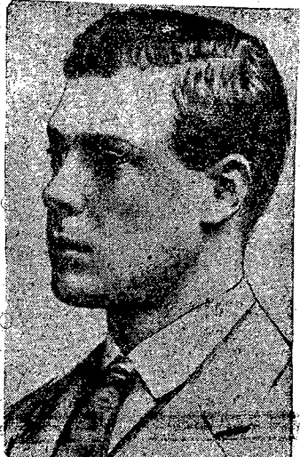
Król Edward VIII.

czas na te aluzje, jak twierdzą w kołach poinformowanych, premier Baldwin oświadczył, że jeżeli król nie zajmie stanowiska w tej kwestii to rząd przedłoży parlamentowi projekt usta-