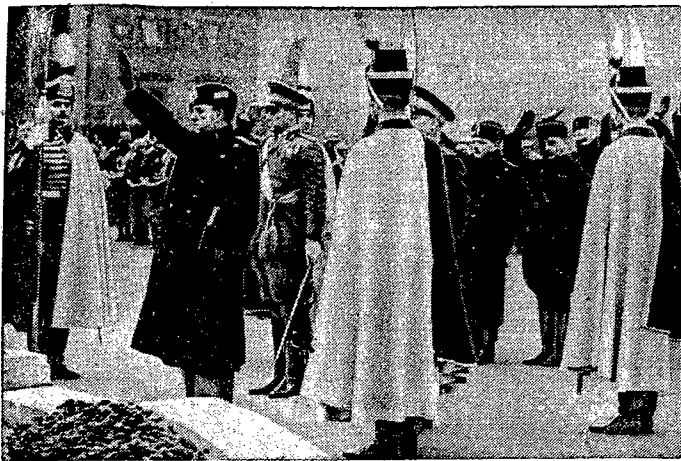
Wizyta min. Ciano w Budapeszcie.

Włoski minister spraw zagr. hr. Ciano po odwieczeniu Berlina i Wiednia przybył do Budapesztu gdzie odbył kilka ważnych konferencji politycznych. — Na zdjęciu hr. Ciano przy grobie Nieznanego Żołnierza.