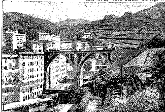
Włochy budują specjalne drogi dla aut ciężarowych.

wie bezpośrednio przed nadlatującym samolotem, który, przy zetknięciu się z siecią, ulega katastrofie.