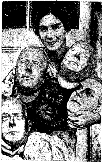
Przed koronacją króla Anglii.

W związku ze zbliżającym się terminem koronacji króla Edwarda VIII-go w różnych zakładach angielskich widać gorączkową pracę. Np. setki ludzi znalazło zatrudnienie przy wyrobieniu w kilkutysięcznych maszynach, różnych wielkości i koloru, które posłużą do dekoracji ulic w dniu koronacji. — Na zdjęciu naszym pierwsze maski.