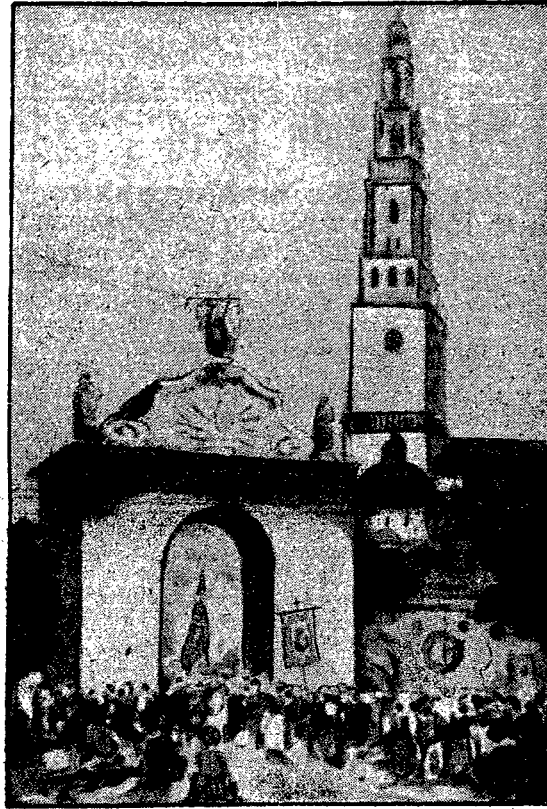
Jasna Góra w dniu uroczystości odpustowych.

W kołach politycznych liczą się z możliwością szybszego zwołania sesji parlamentarnej, aniżeli to przewiduje nowa Konstytucja. Normalna sesja sejmowa musi się rozpocząć najpóźniej w listopadzie, tymczasem nie jest wykluczone, że zwołanie sesji nastąpiłoby jeszcze w październiku. Pod obrady przyszłyby przede wszystkim sprawy gospodarcze oraz projekty socjalne. Nie należałoby się tedy liczyć z przerwą miesięcznej sesji, raczej miałoby się do czynienia z sesją pełnego okresu.