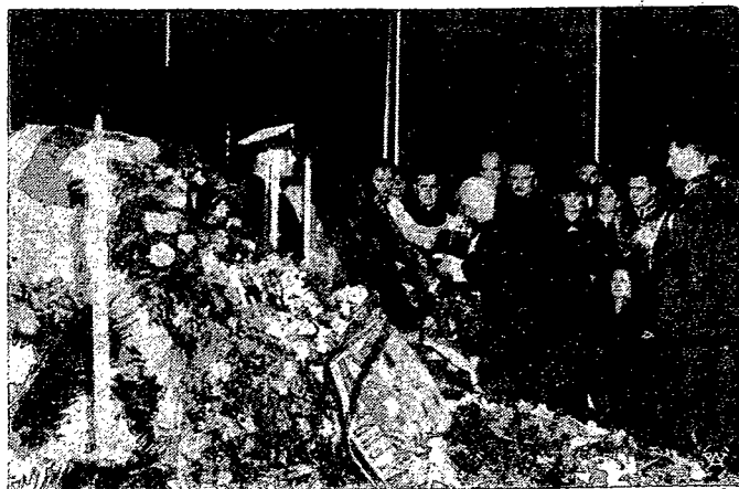
Zdjęcie przedstawia moment dekoracji przez P. Prezydenta Rzeczypospolitej trumny ze zwłokami gen. Grlicz - Dreszera wielką wstęgą orderu „Polonia Restituta”.

Paryż. — Minister spraw zagranicznych Delbos udaje się jutro po południu do Londynu. Premier Blum odleci w czwartek rano samolotem. Dziś zbierają się w Pałacu Elizejskim pod przewodnictwem prezydenta Lebruna rada ministrów, która omówi całokształt sytuacji międzynarodowej ze specjalnym wyprzedzeniem konferencji trzech ministrów. Delbos przyjął wczoraj ambasadora polskiego Łukasiewicza oraz ambasadora sowieckiego Potemkina.