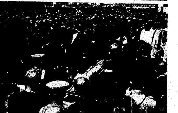
Zdjęcie przedstawia moment złożenia trumny ze zwłokami gen. Orlicz-Dreszera do grobu na cmentarzu wojskowym w Okęsywie.