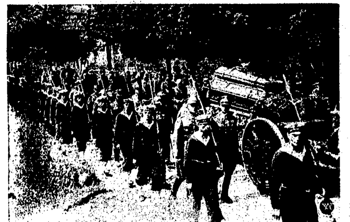
Zdjęcie przedstawia trumnę ze zwłokami gen. dyw. Orlicz - Dreszera eskortowaną przez kom. panie honorową oddziału marynarki wojennej.