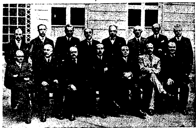
Nowy rząd belgijski. Zdjęcie nasze przedstawia członków nowoutworzonego rządu belgijskiego z premierem Van Zeelandem na czele. Siedzą: Van Isacker, Pierlot, Vandervelde, Van Zeeland, Bovesse, de Man i Spaak. Stoją: Rubbens, de Schryver, Delatre, Hoste, Merlot, Gl. Denis, Jasnar, Bouchory.

W Tulonie doszło do porozumienia w stożniach. Praca ma być podjęta dzisiaj. Minister spraw wewnętrznych zwołał na dziś posiedzenie delegacji przedsiębiorstw pracowników wielkich magazynów paryskich. Wczoraj sekretarze generalnej konferencji pracy odwiedzili wielkie magazy-