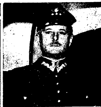
Nowy wojewoda krakowski.

Jerozolima. — Położenie w Palestynie jest w dalszym ciągu niepokojące. Strajk Arabów trwa. Zanotowano nowe akty terroru arabskiego. Do starej dzielnicy miasta