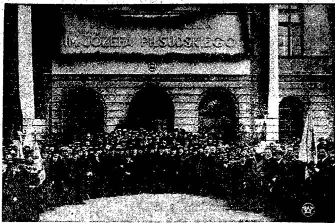
Gimnazjum państw. w Ostrowie Wielkopolskim.

W tym wypadku zwróci jednak Francja uwagę całej światowej opinii publicznej, że jeżeli Anglia nie zechce postępować w przyszłości w odniesieniu do Niemiec z taką samą energią, jak wobec Włoch, to taka polityka Wielkiej Brytanii doprowadzi bezwzględnie do poważnego zaostrezenia sytuacji w Europie co może stać się nawet bezpośrednią przyczyną wybuchu nowej wojny europejskiej.