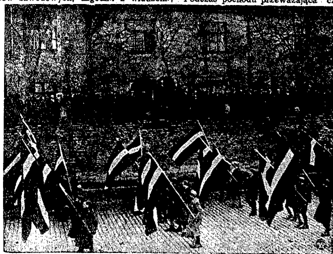
Manifestacje na Lotwie.

Z okazji objęcia trzedy Prezydenta Państwa przez dotychczasowego Prezesa Rady Ministrów K. Ułanisa odbyły się w Rydze wielkie manifestacje ludności na cześć nowej Głowy Państwa. Zejście nasze przedstawia fragment pochodu tyślicznych rzesz studentów, uczniów i wieśniaków, robotników i rzemieślników wraz ze sztandarami, przed pałacem Prezydenta Państwa ozdobionymi flagami. Widoczny na naszym zdjęciu Prezydent Ułanisz przyjmuje z balkon hold ludność.