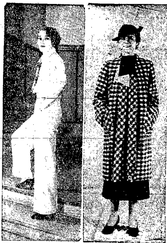
Z rewil m6d w Warszawie.