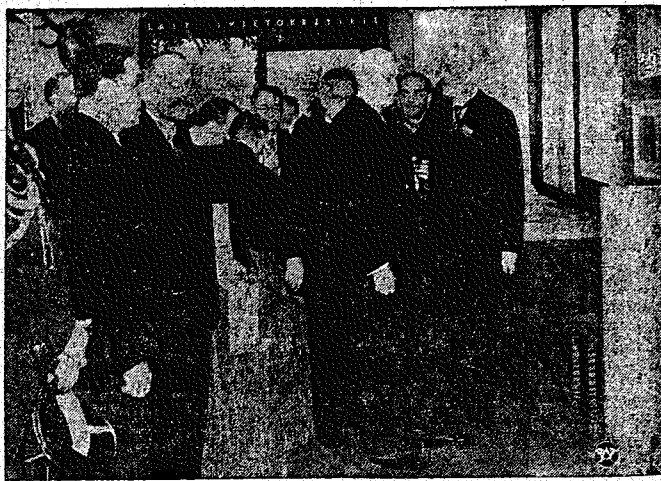
P. Prezydent Rzplitej na wystawie Świętokrzyskiej. P. Prezydent Rzplitej zwiędział w towarzystwie ministra Spraw Wojskowych gen. Kasprzyskiego i ministra W. R. i O. P. prof. Świętosławskiego wystawie Świętokrzyską w Kasynie Garnizonowym w Warszawie.

W pewnym momencie oddział japońsko-mandżurski zdołał zbliżyć się do tej