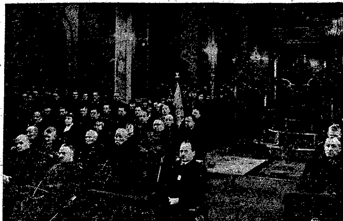
Nabożeństwo żałobne w rocznicę zgonu ś. p. ks. Biskupa Bandurskiego.