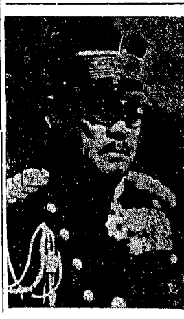
REWOLTA WOJSKOWA W JAPONII.

Nankin. — W kołach politycznych budzi się optymistyczne oczekiwanie, że wobec likwidacji w Japonii rewolty skrajnych militarystów w nowym rządzie min. Hirota będzie nadal ministrem spraw zagranicznych i że wobec tego prowadzona przezeń polityka pojednawcza w stosunku do Chin będzie wprowadzona w życie.