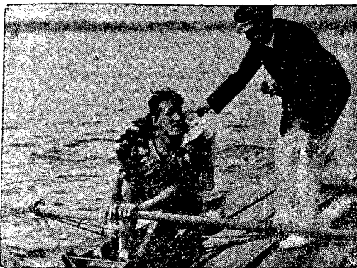
wzorem sportowca amatorskiego karnego, rycerskiego, skromnego i obowiązującego.