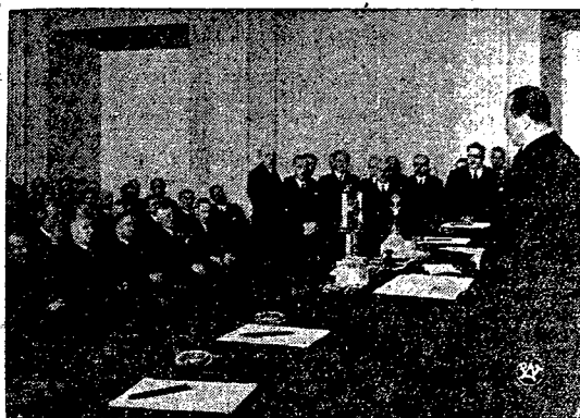
Wielka narada gospodarcza w Warszawie.

Pierwsze posiedzenie Komisji Osmnastu wyznaczono na poniedziałek o godz. 15.30. Przewodniczyć jej będzie Portugalczyk Vasconcellos.