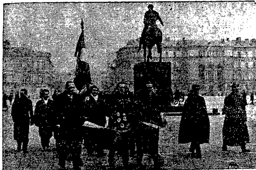
W hołdzie Nieznanemu Żołnierzu.

Za każdym morderstwem, dokonanem przez „miewinnych podjudzonych Niemców”, kanclerz widzi „zawsze też samą potęgę wroga żydowskiego, któremu Niemcy nie zleżą nie wyrzuciły, a który mimo to usiłował z narodu niemieckiego uczy-