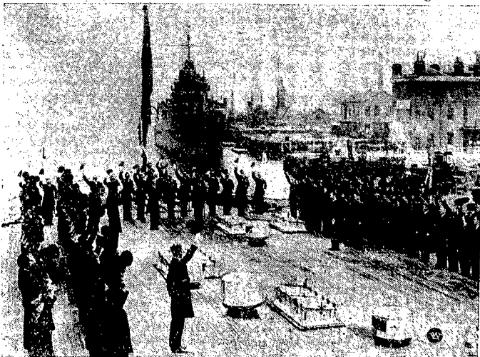
Królewska marynarka brytyjska pozdrawia nowego króla. W dniu proklamacji nowego króla, z okrętów marynarki wojennej brytyjskiej oddano 21 strzałów salutowych, a wszystkie flagi zostały na ten dzień wciągnięte na maszty i opuszczone, na znak żałoby po śmierci Jerzego V-go, dopiero na drugi dzień,

Wszystkie przedsiębiorstwa powinny być równo postawione pod względem podatków, świadczeń, inspekcji, taryf