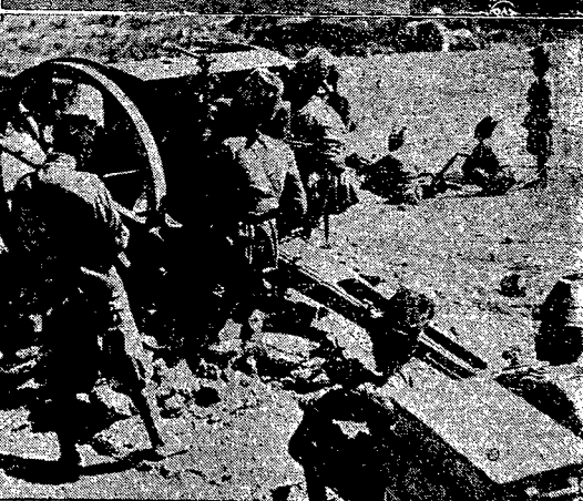
1 i 2) — PRZEKAZANIE DOMKÓW WETERANOM. — W dniu 22 b. m. w 73-ą rocznicę Powstania styczniowego „Bratnia Pomoc b. uczestników walk o niepodległość” przekazała dwóm weteranom por. Mamerowi Wandemu i por. Polikowi Potolwskiemu domki zbudowane w osiedlu w Babicach. Na zdjęciu 1 — fragment uroczystości przekazania kluczy. Na zdjęciu 2 — widok ogrody domków weteranów na Babicach. 3) — EDWARD VII, JERZY V I EDWARD VIII. — Obecny król angielski, ówczesny książę Wali, wraz ze swym ojcem królem Jerzym V i dziadkiem Edwardem VII. Zdjęcie to zrobione jest w 1902 r. 4) — NA FRONCIE ABISYNSKIM. — Obsługa polowego działu włoskiego złożona z asanów. Zdjęcie to zostało zrobione przed bitwą nad Dolo, w grupie wojsk generała Graziani. 5) — POLSKIE SAMOLOTY W ATENACH. — Król grecki Jerzy wnieśli kpt. Orlińskiemu, który na polskim typie samolotu „Erwudzie”, dokonał ciekawych demonstracji.