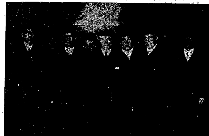
Ministrowie holenderscy w Warszawie. W ub. plutek przybył do Warszawy dwaj członkowie rządu holenderskiego: minister przemysłu i handlu i żeglugi prof. Gellisen oraz minister rolnictwa i rybołówstwa Deckers. Na zdjęciu ministrowie na dworcu głównym w Warszawie.

Warszawa. — Jak donoszą dekret o redukcji mężatek nie zostanie ogłoszony. Natomiast istnieje możliwość wprowadze-