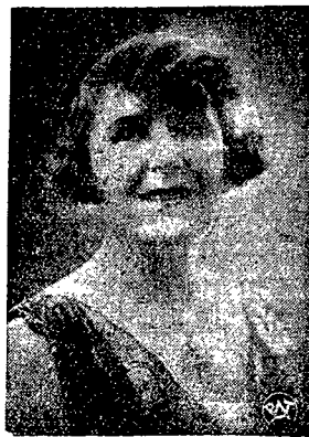
Zofia Natkowska — laureatka.

Znakomita pisarka Zofia Natkowska, członkini Polskiej Akademii Literatury, otrzymała tegoroczną nagrodę literacką Min. W.R. i O.P.