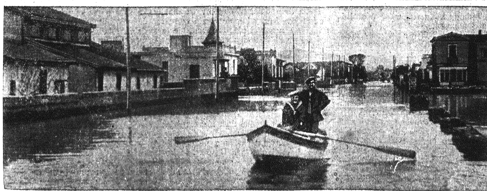
Żywiłowa katastrofa w stolicy Grecji. — Gwałtowny huragan i powódź nawiedziła Ateny. Skutkiem powodzi wiele domów runęło, nie które dzielnice miasta zostały formalnie zniszczone przez wezbrane fale. Dotychczas odnaleziono zwłoki 25 ofiar katastrofy. — Na zdjęciu jeden z patroli ratowniczych, które po katastrofie objeżdżają na łodziach zatopione ulice, aby nieść pomoc mieszkańcom.

Granica fińska została obstawiona licznymi posterunkami. Setki więźniów blakają się po lasach, skazani na śmierć od kul patroli GPU. lub zimna i głodu. W niektórych okolicach zbiegowie bronią się przed pościgiem przez podpalanie lasów. Tajga płonie na szerokiej przestrzeniach tembardziej, że brak rąk dla gaszenia pożaru.