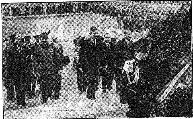
Kanceler Austrii u grobu Nieznanego Żołnierza w Rzymie.

Następnie zabrał głos francuski minister spraw zagr. Laval, który również w gorących słowach podkreślił zasługi obu zmarłych w dziedzinie organizacji pokoju. Mówca zaznaczył, że będzie się starał iść śladami s. p. min. Barthou i będzie kontynuował jego dzieło pokoju.