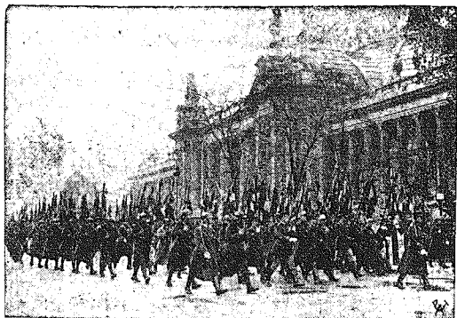
Obchód rocznicy zawieszenia broni w Paryżu. W dn. 11-go b. m. obchodził Paryż uroczyste rocznicę zawieszenia broni. Na zdjęciu — defilada b. uczestników wojny ze sztandarami przed Pałacem Elizejskim.