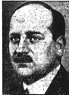
Min. Flandin podjął się misji utworzenia rządu.