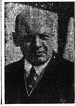
Ambasadorowie Polski w Berlinie i Rzeszy w Warszawie. Rząd polski oraz rząd niemiecki wspólnie postanowili powołania swe w Warszawie i Berlinie podnieść z dniem 1 listopada do rangi ambasadorów, ambasadorami zostali mianowani dotychczasowi posłowie. Na zdanie ambasador niemiecki w Warszawie Hans Adolf von Moltke (na lewo) oraz ambasador R. P. w Berlinie p. Józef Lipiński (z prawej).

Warszawa. — Z dniem 1-ym listopada nastąpi obniżka cennika dla sprzedaży węgla z kopalni. Na podstawie dezzyderatów ministerstwa przemysłu i handlu, walne zgromadzenie kopalni, wchodzących w skład polskiej konwencji węglowej powzięto uchwałę co do obniżki sprzedaży węgla, a mianowicie: a) dla cen węgla gatunków grubych N wszystkie sortymenty ponad 40 MM o 12 proc., b) dla cen węgla gatunków średnich sortymenty poniżej 40 MM o 15 proc., c) dla cen mięlsu o 3 proc. Równocześnie ministerstwo komunikacji postanowiło obniżyć taryfy przewozowe dla węgla wszystkich gatunków, stosownie do odległości przewozowych, a mianowicie: dla przewozu węgla kamienia obniżka taryfy wyniesie od 7 do 26,3 proc., dla przewozu miálu węglowego od 3,3 do 14,4 proc. i dla przewozu koksu o 5 proc. Obniżone stawki przewozowe wpłyną oczywiście na dalsze obniżenie cen węgla dla konsumenta niezależnie od obniżki cennika konwencyjnego. Wreszcie oprócz obniżek powyższych polska konwencja uchwala specjalną 10-procentową obniżkę cen węgla do kresów wschodnich. Obniżone w ten sposób ceny węgla wejdą w życie z dniem 1 listopada b. r. Równocześnie zostanie przez ministerstwo komunikacji wprowadzona w życie obniżona taryfa przewozowa.