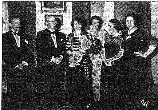
Polski wieczór literacki w Helsingforsie.

Dwustu tysięczne miasto Nantes żyje w czwartek od samego rana w niebывалym podnieceniu. Hotele mieszczą z trudem 2,000 delegatów partji radykalnej, ich sekretarzy i urzędników oraz kilkuset dziennikarzy. Obrady kongresu odbywają się w największej sali w mieście t. zw. „Salle Mauduit“, przybranej trójkolorowymi sztandarami.