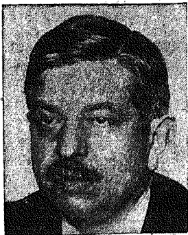
B. premier Pierre Laval nowy francuski minister spraw zagranicznych.