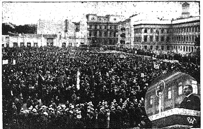
Wspaniała manifestacja stolicy.

Statut Challenge'u przewiduje, że puhar po trzykrotnym zwycięstwie pozostaje w rękach zwycięskiego klubu. Ponieważ dotąd dwa razy zwyciężyli Niemcy i dwa razy Polacy, trzeci międzynarodowy turniej lotniczy zdecyduje o os-