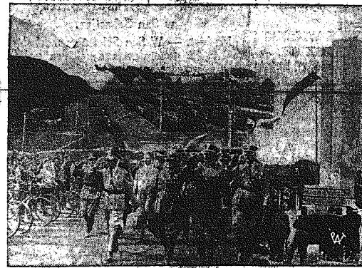
Uroczystość Federacji P. Z. O. O. w Postawach.