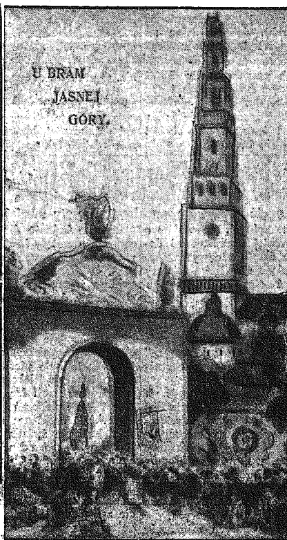
U BRAM JASNEJ GÓRY.