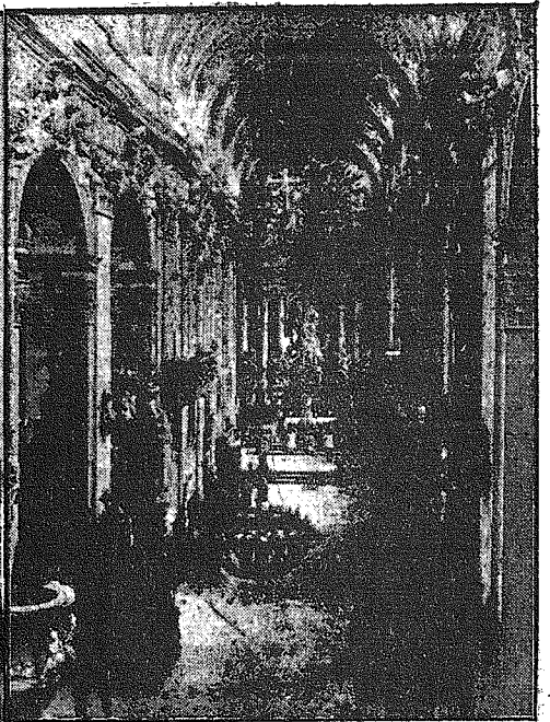
Wnętrze Wielkiego Kościoła Bazyliki Jasnogórskiej. Piękna świątynia w stylu czystego baroku, bogato zdobiona i odnowiona wielkimi kosztami w 1934 roku. Początek zabudowań klasztornych i wspaniałej Bazyliki datuje się od czasów panowania łobodzkiego króla Władysława Jagiełły, pogromcy Krzyżaków.

Święto narodzenia Najświętszej Maryi Panny jest bardzo starożytne, ponieważ obchodzone było uroczystej już w VII w., ale nie w całym Kościele. Dopiero św. Piotr Damjan mówi o tym święcie jako o powszechnym (w. XI). Z czasem zaczęło to uroczystość przesuwać na niedzielę najbliższą po 8 września. W 1911 r. Papież Pius X zniósł obowiązek słuchania tego dnia Mszy św. i wstrzymanie się od pracy, a z wprowadzeniem u nas nowego kodeksu w 1918 r. święto to przestało być uroczystością. Wobec ciężkich warunków klasztoru pracujących z dniem wynagrodzeniem, Kościół zniósł niektóre święta. Na Jasnej Górze i w Częstochowie dzień 8 września, jako dzień Narodzenia Najświętszej Maryi Panny, po wszechczasie obchodzony był z niezwykłą uroczystością. Rok rocznie na ten dzień przybywała z różnych stron Polski niezliczone rzesze pątników, aby w dniu odpustu złożyć hołd przed Cudownym O-