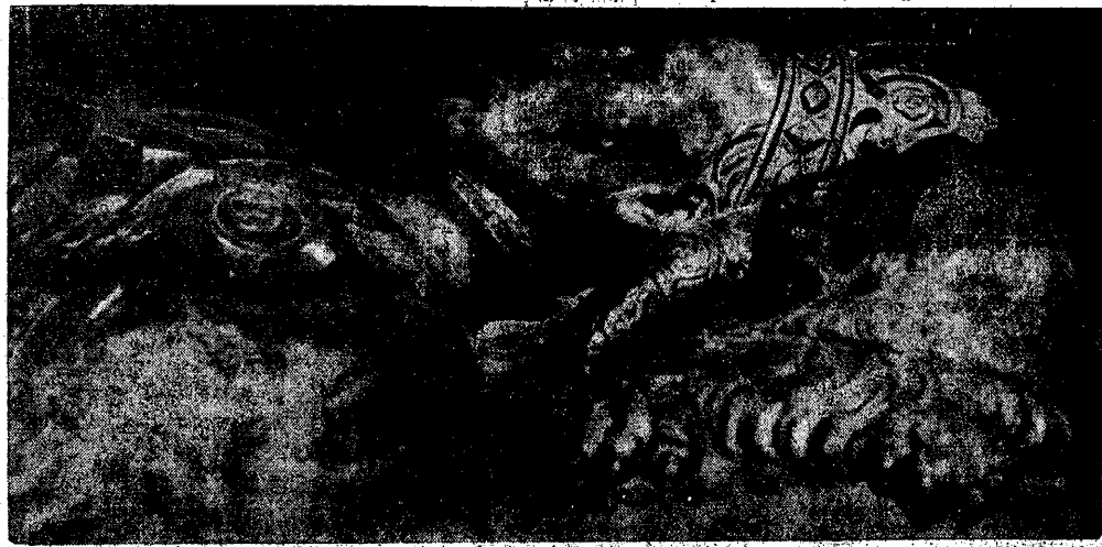
Głowa króla Władysława Jagiełły. — Fragment nagrobka marmurowego pogromcy Krzyżaków pod Grunwaldem, znajdującego się w katedrze wawelskiej w Krakowie.

Postać króla zatoczyła dynastji i stała się raz zajaśniała na łożu śmierci. Król