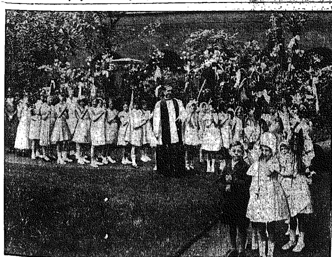
Wybór królowej wiosny.

W dniu dzisiejszym otoczmy Ją troskliwością, czy to w kółku rodzinnym, czy w towarzystwie, by żaden cień smutku nie zasępil Jej czoła.