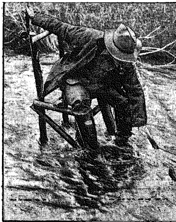
Sezon wędkarski rozpoczęty. Kanadyjski łowca psstrągów usadówił się wygodnie przy przodku warkłowego strumienia.

Czy wiecie że... ...pomyślnie ukończone zostały badania przyrodników w Anglii, którzy pracowali nad poznananiem budowy oka motyla. Doszli oni do bardzo ciekawych wyników, tłumaczących nieuzasadnione, jakby się zdawało, działanie przyciągające na motyle niepozornych białych kwiatów, okazało się bowiem, że motyl widzi wiele promieni niedostrzegalnych dla oka ludzkiego, przez co barwa biała przedstawia mu się jako szereg jaskrawych kolorów. ...woda jest pożywna, jak to świadczą, że człowiek o samej wodzie może przeżyć 20 dni, koń 25, kot 20, pies 30 dni, a żółw zaś bez pokarmu i bez wody dopiero po 2-3 lub 3-4 latach umiera.