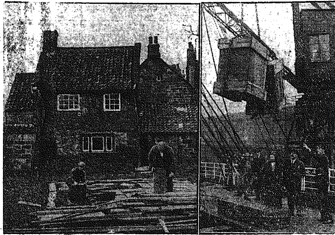
Dom rodzinny Cook'a przeniesiony zostanie z Anglii do Australii. Dom, w którym urodził się Cook, ulega rozbiórce, a każdy kamień jest oznaczony i notowany, w których zapakowane są kamienie z domu Cook'a.