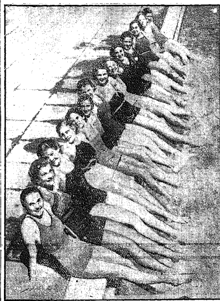
Sezon kąpielowy rozpoczął.

część burty zostały opalone, a instalacja elektryczna uszkodzona. Meteor wyrwał się z przestrzeni kosmosu i spadł na ziemię jak pocisk. Z niesłychaną szybkością przebiegł pas atmosfery ziemskiej i rozpalił się do białości