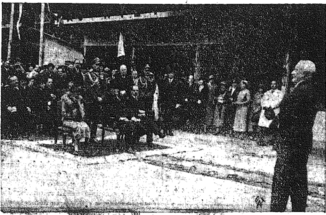
Otwarcie wystawy „Len Polski” w Warszawie. W sobotę Pan Prezydent Rzplitej w otoczeniu członków rządu i przedstawicieli Sejmu i Senatu dokonał otwarcia wystawy „Len Polski” urządzonej w Dolinie Szwajcarskiej staraniem Muzeum Przemysłu i Rolnictwa w Warszawie i Tow. Lniarskiego w Wilnie. Na zdjęciu — Pan Prezydent Rzplitej z małżonką oraz członkowie rządu podczas przemówienia gen. Żeligowskiego, pioniera lniarstwa polskiego.

Wiedeń. — Wiedeńskie biuro korespondencyjne donosi z Sofji: Rozwiązanie przesilenia gabinetowego zostało gorąco powitane przez narodową i konserwatywną opinię publiczną w Bułgarii. Wobec tego, że dotychczas premier Muszanow nie zdołał utworzyć nowego rządu, król Borys zamianował w sobotę w nocy po-