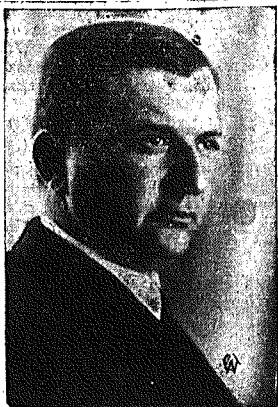
Nowy minister Przemysłu i Handlu. Henryk Floyar Rajchman.

Sprawa rozwiązania sejmu nie została jeszcze zdecydowana. Nastąpi to po rezygnacji gabinetu.