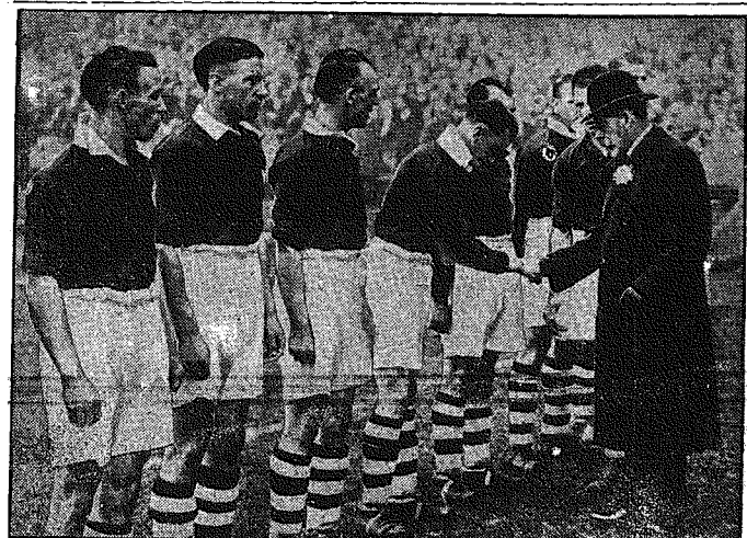
Po rozgrywce piłkarskiej na stadionie w Wembley. Król angielski składa powinszowanie zwycięskiej drużynie Manchesteru, która w zaciętej rozgrywce z drużyną Portsmouth w obecności 100.000 widzów zdobyła puchar Anglii, największe trofeum angielskiego sportu piłkarskiego.