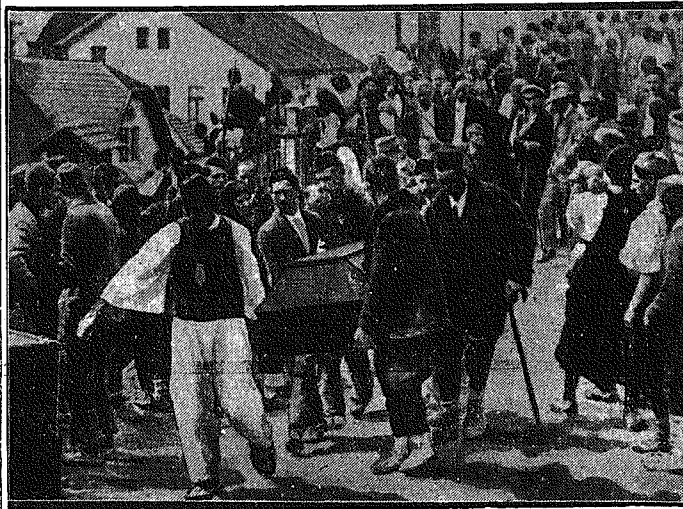
Po strasnej katastrofie w kopalni. Górnicy serbscy wnoszą trumnę ze zwołkami towarzysza, poległego w strasnej katastrofie Visoko, gdzie 136 górników znalazło śmierć wskutek wybuchu gazów.

(X) Gdzie smarują najgrubiej chleb masłem? Produkcja i konsumpcja masła w Kanadzie osiągnęła olbrzymie rozmia-